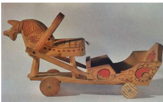
Рис. 11. Коник в упряжи (1930-е годы) 1

К возрожденным промыслам относится и фодосеевская игрушка. Это яркий образец самобытного промысла топорно-щепной игрушки. Простая по форме и конструкции, она отличается незатейливым, но ярким орнаментом. Возникновение данного промысла относится к концу XIX в., а его основателем считается Яков Александров [Прокопьев, 1939, с. 113]. Игрушки изготавливали из деревянной чурки с помощью ножа и топора. Для росписи довоенного времени было характерно использование ярких зеленых и красных цветов. Фон при этом не закрашивался (рис. 11).