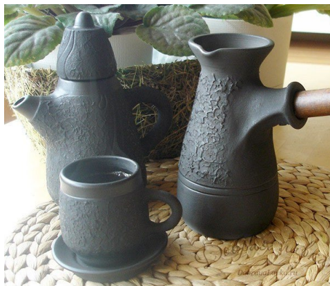
Рис. 4. Сервиз работы мастеров Щипановых 1

находится в Балахне. По старинной технологии дровяного бескислородного обжига XVI в. мастера создают чайные и кофейные сервизы, свистульки, мелкую пластику, скульптуры [Керамика Щипановых]. (Рис. 4.) Стоит отметить, что сегодня изготовление чернолощеной и обварной керамики - явление достаточно редкое вследствие сложности технологии. В мастерской работают как сам мастер, так и его дети.