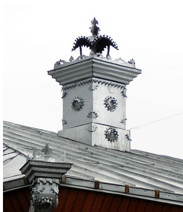
Рис. 1-2. Городецкие дымоходы 1

В селе Казариново Большеболдинского района с XVI в. занимались изготовлением керамики. Казариновская посуда отличалась своеобразием: поверх аспидно-серого цвета наносился лощеный геометрический узор [Прокопьев, 1939, с. 145]. (Рис. 3.)