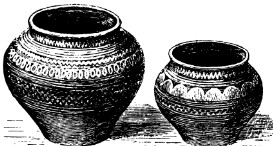
Рис. 3. Горшки с. Казариново. (Рис. по фотографии)

В селе Казариново Большеболдинского района с XVI в. занимались изготовлением керамики. Казариновская посуда отличалась своеобразием: поверх аспидно-серого цвета наносился лощеный геометрический узор [Прокопьев, 1939, с. 145]. (Рис. 3.)