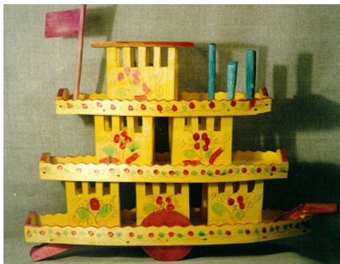
Рис. 12. Игрушка «Пароход» 2

Поскольку любой промысел не является статичным культурно-историческим феноменом, механизм изготовления федосеевской игрушки как образчика традиционного промысла также претерпел некоторые изменения. В частности, мастера стали окунавать заготовку в тазы с желтым анилином, после чего расписывать, добавляя яркие пятна алого и зеленого фуксина. Таким образом, возник другой вариант росписи игрушки (рис. 12).