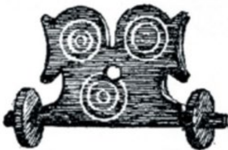
Рис. 6. Каталка-колесики (по гравюре Грозевского)

Частотным для новинской игрушки было изображение близнецных коней (рис. 6). Образ двуглавого коня встречался еще в Древнем Египте, у сарматов и скифов. У славян он служил символом Солнца – осеннего и весеннего, потому неслучайным становится изображение белых концентрических кругов на игрушке – цикличность, круг жизни, солнце.