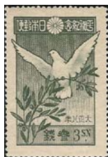
Рис. 1. Японская марка в ознаменование окончания Первой мировой войны (1919)

В 1919 г. в Японии была выпущена серия марок в ознаменование Версальского мира. На двух из них изображен белый голубь без атрибутов, но ветви оливы представлены в орнаменте; на двух других он сидит на оливковой ветви [рис. 1].