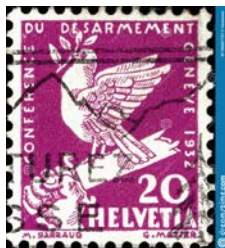
Рис. 2. Почтовая марка Швейцарии в честь конференции по разоружению в Женеве (1932)

На швейцарской марке, выпущенной к Женевской конференции по разоружению 1932 г., голубь с оливковой веткой в клюве сидит на сломанном мече [рис. 2]. На французской марке 1934 г. (худож. Ж.Г. Даранье) голубь в полете держит в клюве большую оливковую ветвь.