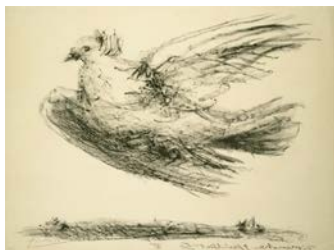
Рис. 5. Рисунок Пикассо для плаката ко II Всемирному конгрессу сторонников мира (Лондон, 1950)

На плакате Пикассо ко II Всемирному конгрессу сторонников мира (Шеффилд и Варшава, ноябрь 1950) изображен летящий голубь без ветви [рис. 5]. Несколько раньше Пикассо нарисовал плакат для Встречи франко-итальянской дружбы в Ницце за запрет атомного оружия (август 1950 г.). Здесь девушка держит голубя на ладони, а в центре плаката помещена оливковая ветвь. Этот голубь намного ближе к условному, эмблематическому, чем голуби на двух описанных выше плакатах.