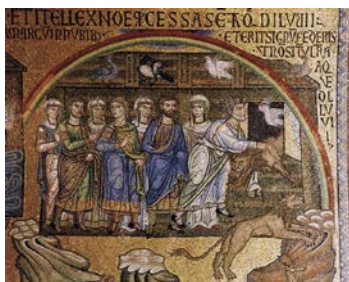
Рис. 10. Ной и его семья выходят из ковчега. Мозаика Собора Св. Марка (Венеция, XI–XII вв.)

начало VI в.) изображено крещение в Иордане; на Иисуса слетает голубь, а сверху раскинулась радуга. На мозаике в венецианском соборе Св. Марка (XI–XII вв.) голубь вылетает из ковчега, над которым раскинулась радуга [рис. 10].