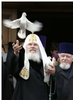
Рис. 9. Патриарх Алексий II выпускает голубей после литургии в Благовещенском соборе Кремля (1998).

(7 апреля / 25 марта по ст. стилю). С этого времени после литургии в Благовещенском соборе Кремля патриарх выпускает голубей со ступенек собора [рис. 9]. То же происходит во многих других храмах. Представители общества «Радонеж» утверждали, что возрождают старый обычай, забытый в годы советской власти [Бубенцова, 2015].