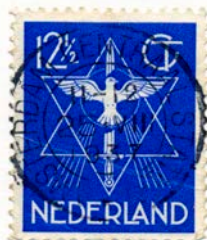
Рис. 3. Почтовая марка «Печать мира» (Голландия, 1932)

По случаю Дня Лиги Наций, отмечавшегося в Голландии 18 мая 1932 г., была выпущена марка, известная под названием «Печать мира» ( нидерл. Vredeszegel). Голубь вписан здесь в гексаграмму, от которой исходят к земле по пяти лучей с двух сторон [рис. 3]. В описаниях марки гексаграмма именуется «звездой мира», а лучи толкуются как сияние звезды над пятью континентами. Голубь изображен анфас, с раскинутыми крыльями, без ветви. В таком виде это уже не голубь из ковчега, а символ Св. Духа, от которого на иконах часто исходит сияние. (Автор дизайна марки П.А.Х. Хофман много работал в области религиозного искусства.) Наименование «Печать мира», возможно, отсылает к масонскому символу «Печать Соломона»: гексаграмма, вписанная в круг.