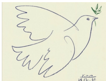
Рис. 6. Литография Пикассо «Голубой голубь» (1961)

мирному конгрессу за всеобщее разоружение и мир (Москва, 1962) голубь с оливковой ветвью сидит на грудке сломанного оружия (образ, встречавшийся на швейцарской марке 1932 г.). Ныне «голубь (голубка) Пикассо» чаще всего ассоциируется с рисунком 1961 г.; многие из позднейших эмблем с голубем мира представляют собой вариации голубок Пикассо.